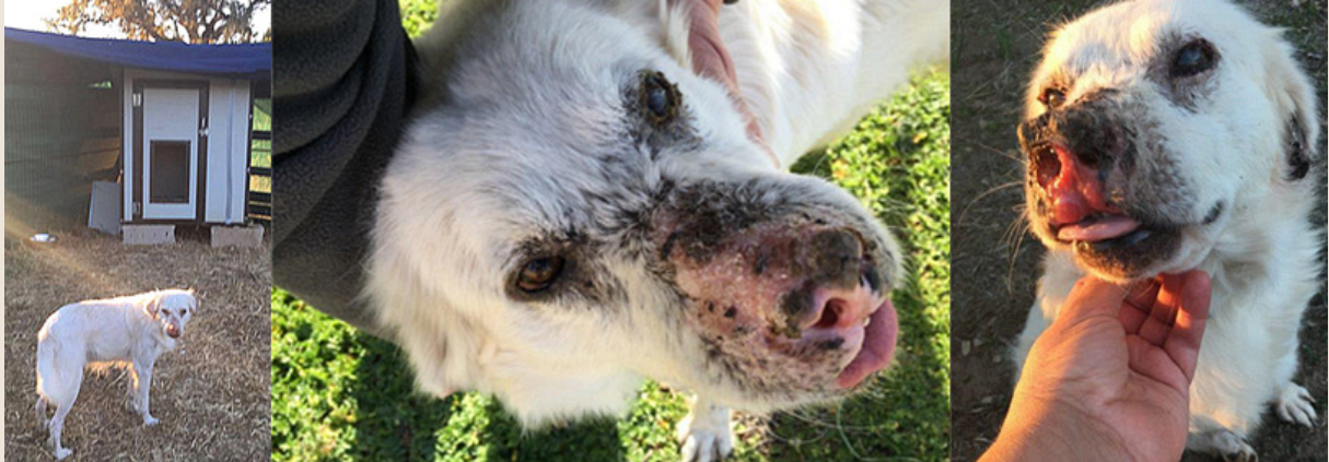
Carino im Mai 2017

Carino entwickelte sich zum wahren Charmeur. Er liebt die Menschen, zeigte sich anhänglich und verschmüsst, brachte sich bald um vor Freude, wenn jemand Zeit hatte, mit ihm im Freilauf zu spielen. Einmal versteckte er sich heimlich im Auto einer Mitarbeiterin, weil er mitfahren wollte. In diesen Momenten hatten wir einen fetten Kloß im Hals. Da ist dieser unkomplizierte Traumhund, der alles dafür geben würde, ein geliebtes Familienmitglied zu sein. Der lange Zeit so schwer vernachlässigt wurde, dass es ihn beinahe das Leben und definitiv ein Augenlicht gekostet hat...Aber da ist auch die Hypothek seiner Krankheit, da sind Berührungssängste. Mancher wird sich vielleicht sogar die Frage stellen, ob man so einen schwer kranken Hund nicht lieber einschläfern sollte. Wir sagen ganz klar: NEIN! Nicht, solange Lebensqualität da ist, solange Freude und Lebenswille uns zeigen, dass es Hoffnung gibt.